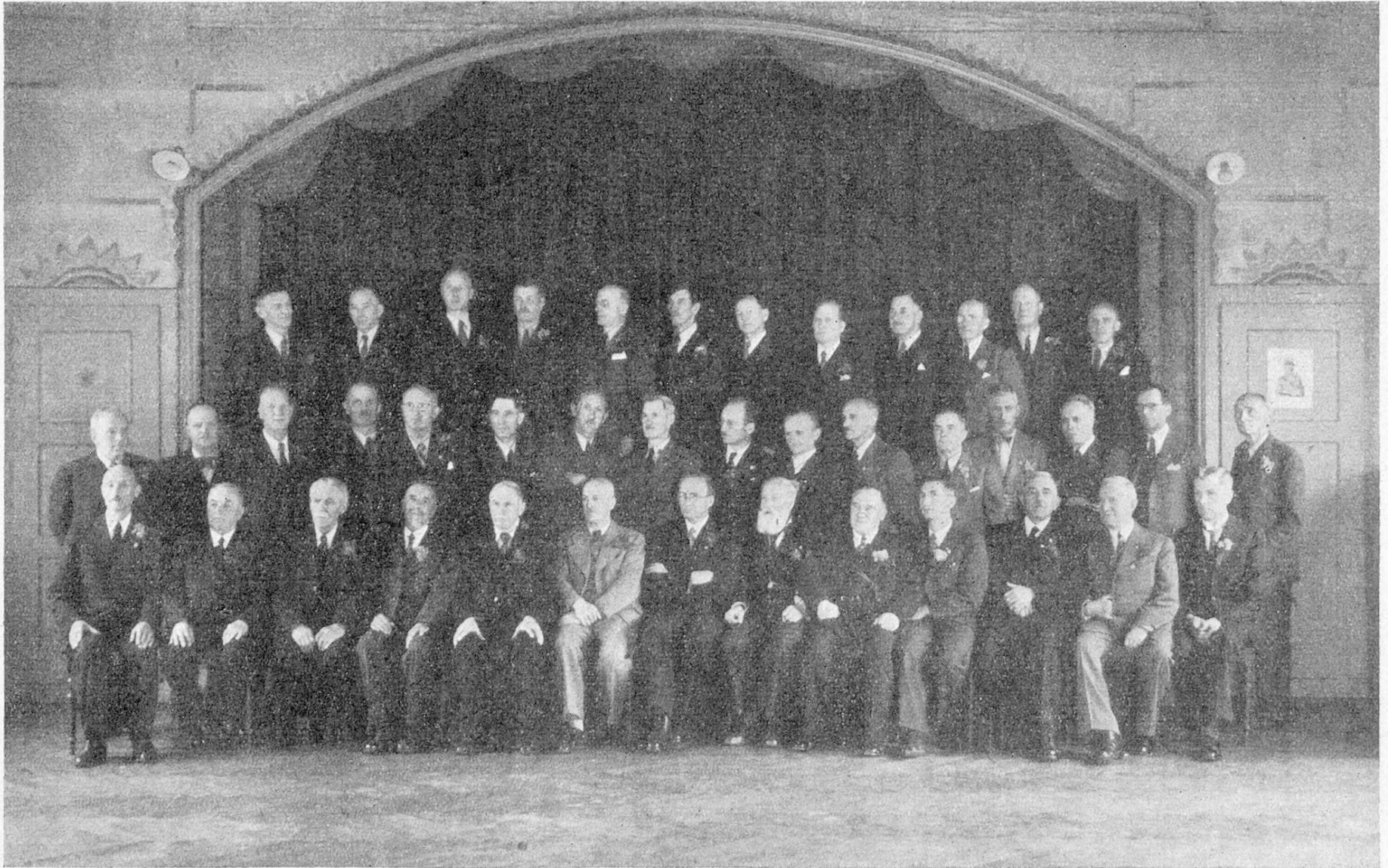
Die ersten Veteranen des EOV.

Die Photographie ist erhältlich bei Photo-Hirt, Ludretikonerstraße 33, Thalwil.