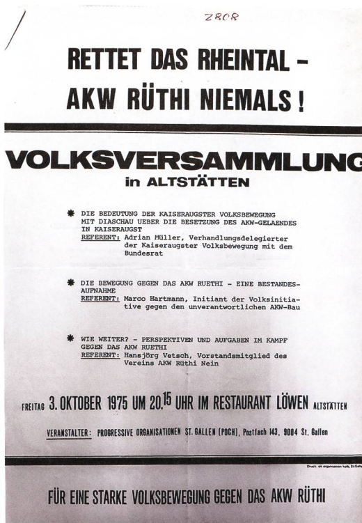
Auch der Verein ARN geriet zusammen mit der POCH ins Visier des Staatsschutzes. Flugblatt, Vorder- und Rückseite, 1975.