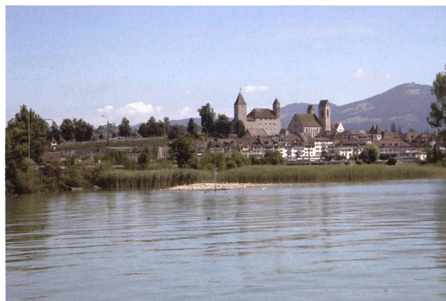
Rapperswil.