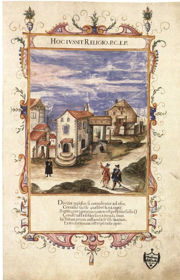
Alte Linsebühlkirche, rechts angefügt das Siechenhaus, das mit einem gedeckten Gang über die Strasse direkt mit der Kirchenempore verbunden war, Aquarell eines unbekanntes Malers, 1613 (Kantonsbibliothek St.Gallen, Vadianische Sammlung, HB 240).

Anders als heute waren städtische Fürsorgeinstitutionen im Spätmittelalter und der Frühen Neuzeit weltliche Grundherrschaften, die ihren sozialen Auftrag nur erfüllen konnten, wenn sie entsprechenden wirtschaftlichen Gewinn machten. 16 Neben dem Heiliggeistspital St.Gallen war das Siechenhaus im Linsebühl die bedeutendste städtische Institution, die über Güterbesitz im städtischen Umland verfügte. Im Laufe der Zeit waren durch Stiftungen und Erwerbungen zahlreiche Besitz- und Abgaberechte an das Siechenhaus gekommen. Wie aus der Auflistung der Einnahmen des Linsebühlamtes von 1588 hervorgeht, setzten sich die Einnahmen des Siechenhauses im 16. Jahrhundert aus dem Güter- und Rentenbesitz (21%), aus dem Milchverkauf (21%), aus dem Weinverkauf (17%), aus Pfrundgeldern und Spenden (12%) und dem Viehverkauf (10%) zusammen. Der Rest der Einnahmen stammte aus den Korn- und diversen anderen Einnahmen. 17 Bemerkenswert ist, dass die abgabepflichtigen