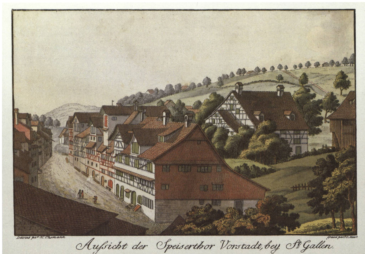
Blick in die Spiser-Vorstadt. Kolorierte Radierung von Heinrich Thomann (1748–1794), graviert von Johann Conrad Mayr (1750–1839), um 1790 (Historisches und Völkerkundemuseum St. Gallen).

im Seelhaus untergebracht und mit den nötigen Medikamenten und der erforderlichen Pflege versorgt wurde. Da diese Behandlungen für die Kranken unentgeltlich waren, trug die öffentliche Hand die Kosten; dies war auch der Grund, weshalb der Rat die Entscheidung fällte. 23