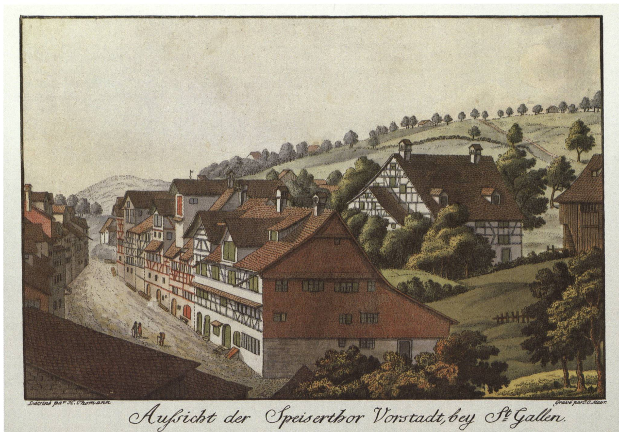
Blick in die Spiser-Vorstadt. Kolorierte Radierung von Heinrich Thomann (1748–1794), graviert von Johann Conrad Mayr (1750–1839), um 1790.

im Seelhaus untergebracht und mit den nötigen Medikamenten und der erforderlichen Pflege versorgt wurde. Da diese Behandlungen für die Kranken unentgeltlich waren, trug die öffentliche Hand die Kosten; dies war auch der Grund, weshalb der Rat die Entscheidung fällte. 23