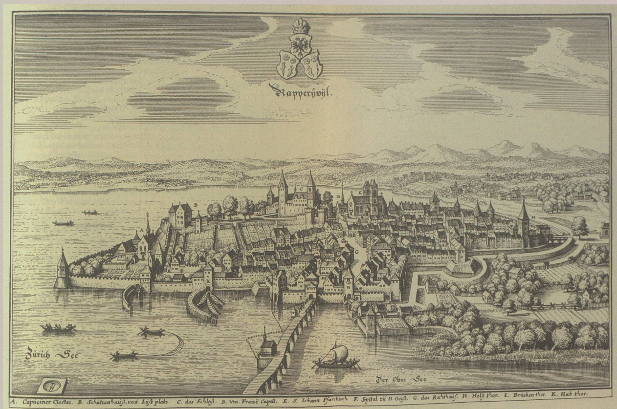
Rapperswil als kleiner Stadtstaat im 17. Jahrhundert, unter der Oberherrschaft der Schirmorte SZ, GL, UR, UW, Kupferstich von Matthäus Merian, 1642.

Dies gelang zu allererst in der Stadt Rapperswil, die grössere Eigenständigkeit genossen und reiche Archivbestände über alle Jahrhunderte bewahrt hatte. Aber auch hier schweifte der Blick nur selten über die eigenen Mauern hinaus. Dank der mittelalterlichen Bedeutung von Burg und Stadt und des Selbstbewusstseins der Bürger, besonders aber dank der gebildeten Stadtschreiber und Geistlichen, entstanden seit dem 15. Jahrhundert die ersten Chroniken, die 1854 durch die wissenschaftliche «Geschichte der Stadt Rapperswil» von Xaver Rickenmann eine Krönung fanden. 2