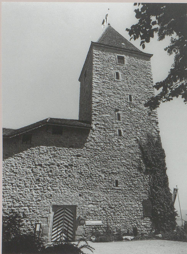
Schloss Rapperswil 1988, historischer und touristischer Anziehungspunkt der Stadtgemeinde Rapperswil-Jona.