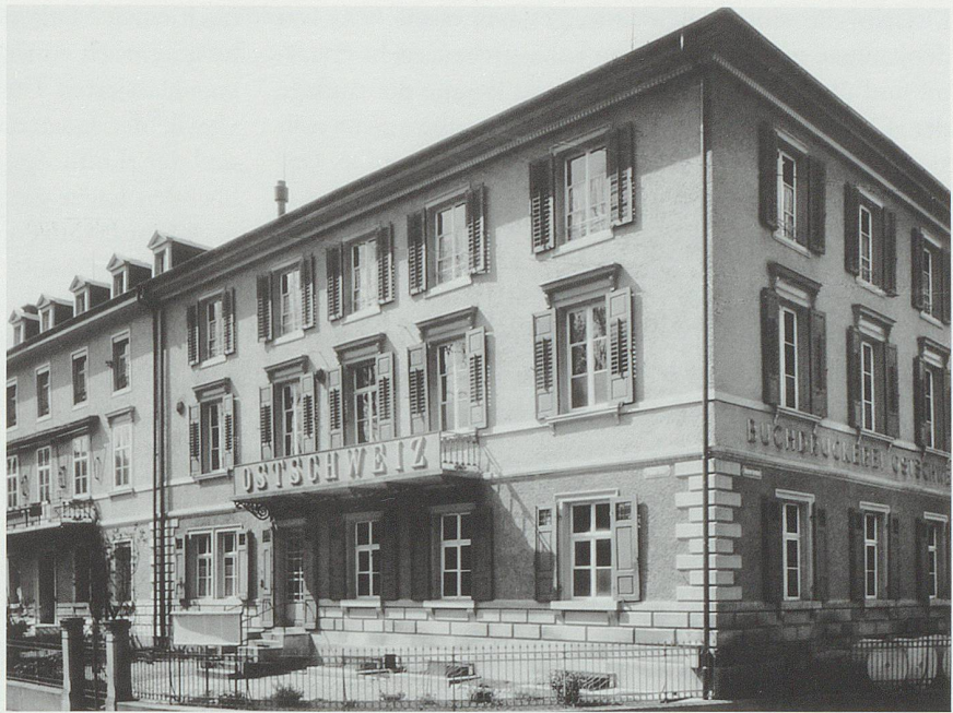
Redaktion und Druckerei «Ostschweiz», 1904

Die Auflage, die vom traditionell freisinnig-liberalen Lager generiert wurde, stieg zwischen 1963 und 2003 dauernd an, und zwar jedes Jahrzehnt um etwa 10 000 Zeitungen, zwischen 1969 und 1980 auch einmal um knapp 20 000 Zeitungen. Zwischen 1990 bis 2003 blieb die Auflage der ehemals freisinnig-liberalen Zeitungen dann aber doch auf deutlich über 90 000 Exemplaren liegen – dies trotz Fusionen und Rückschritt bei den traditionell katholisch-konservativen Titeln. Vor allem war der Zuwachs zwischen 1969 und 1980 bedeutend. In dieser Zeit wuchs die Kantonsbevölkerung bloss von rund 384 000 auf 392 000 Personen, während der Zuwachs in den an-