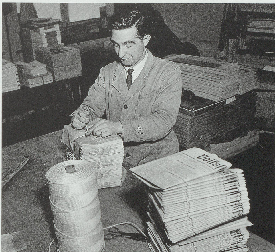
Handverpackung «Volksstimme»