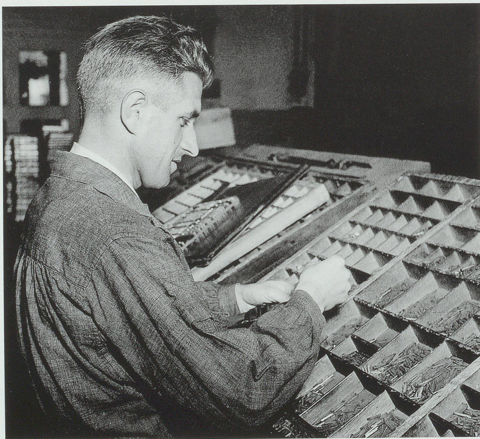
Handsetzerei AZ

Möglich ist ein Überleben mit 5 000 oder gar noch weniger Auflage nur, wenn es keinen Streuverlust gibt und die Inserenten mit einer einzigen und gegenüber einer grossen Zeitung billigen Anzeige alle Haushaltungen erreichen können, oder aber wenn eine kleine Zeitung ein Teil ihrer redaktionellen Seiten von einem interessierten Verbündeten beziehen und somit Kosten sparen kann. Das Erste trifft auf den «Alt-toggenburger», die «Toggenburger Nachrichten» oder den «Allgemeinen Anzeiger» Uzwil zu. Das Zweite ist der Fall bei der Kooperation der «Rheintalischen Volkszeitung» mit der «Südostschweiz».