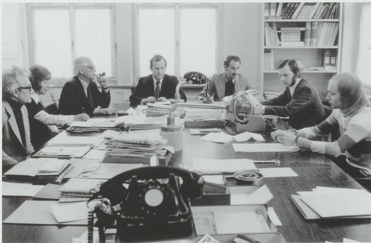
Redaktionskonferenz bei der «Ostschweiz»

So unangefochten wie etwa die beiden Toggenburger Orte Flawil und Wattwil die freisinnig-liberale Tradition vertraten, war kein Druckort katholisch-konservativ. In Wil mischten die Freisinnig-Liberalen mit drei bei sieben katholisch-konservativen Gründungen mit, in Rorschach mit drei bei fünf, in Gossau mit zwei bei fünf Titeln. Rapperswil hatte eine überwiegend freisinnig-liberale Tradition, Uznach war ausgesprägt katholisch-konservativ. Am «katholisch-konservativsten» waren Bazenheid und Bütschwil mit je zwei katholisch-konservativen Gründungen und keiner freisinnig-liberalen. Zwei zu null für die Katholisch-Konservativen gegen die Freisinnig-Liberalen stand es auch in Mels. Aber hier kamen noch zwei demokratische Gründungen dazu.