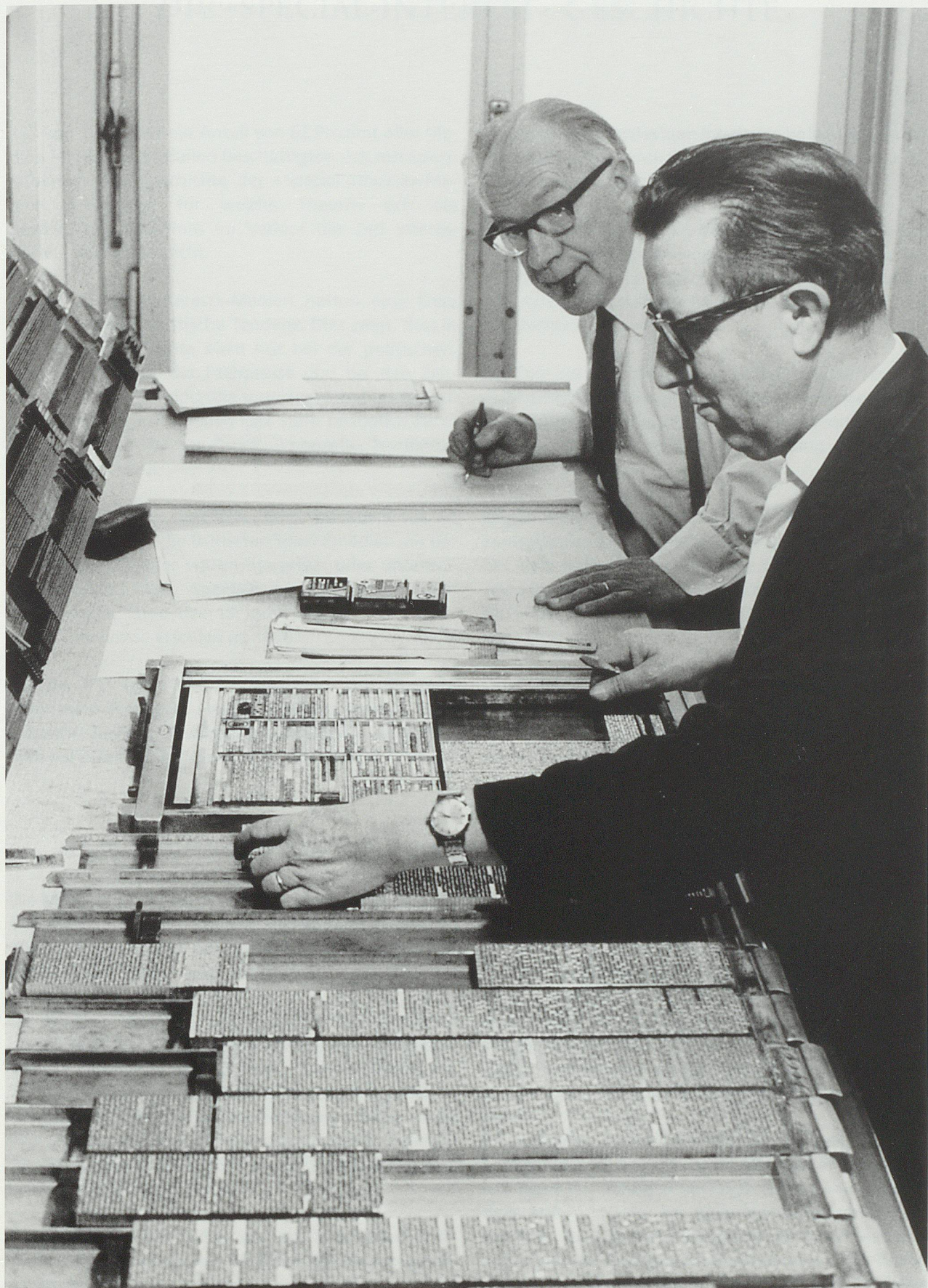
Chefredakteur und Metteur