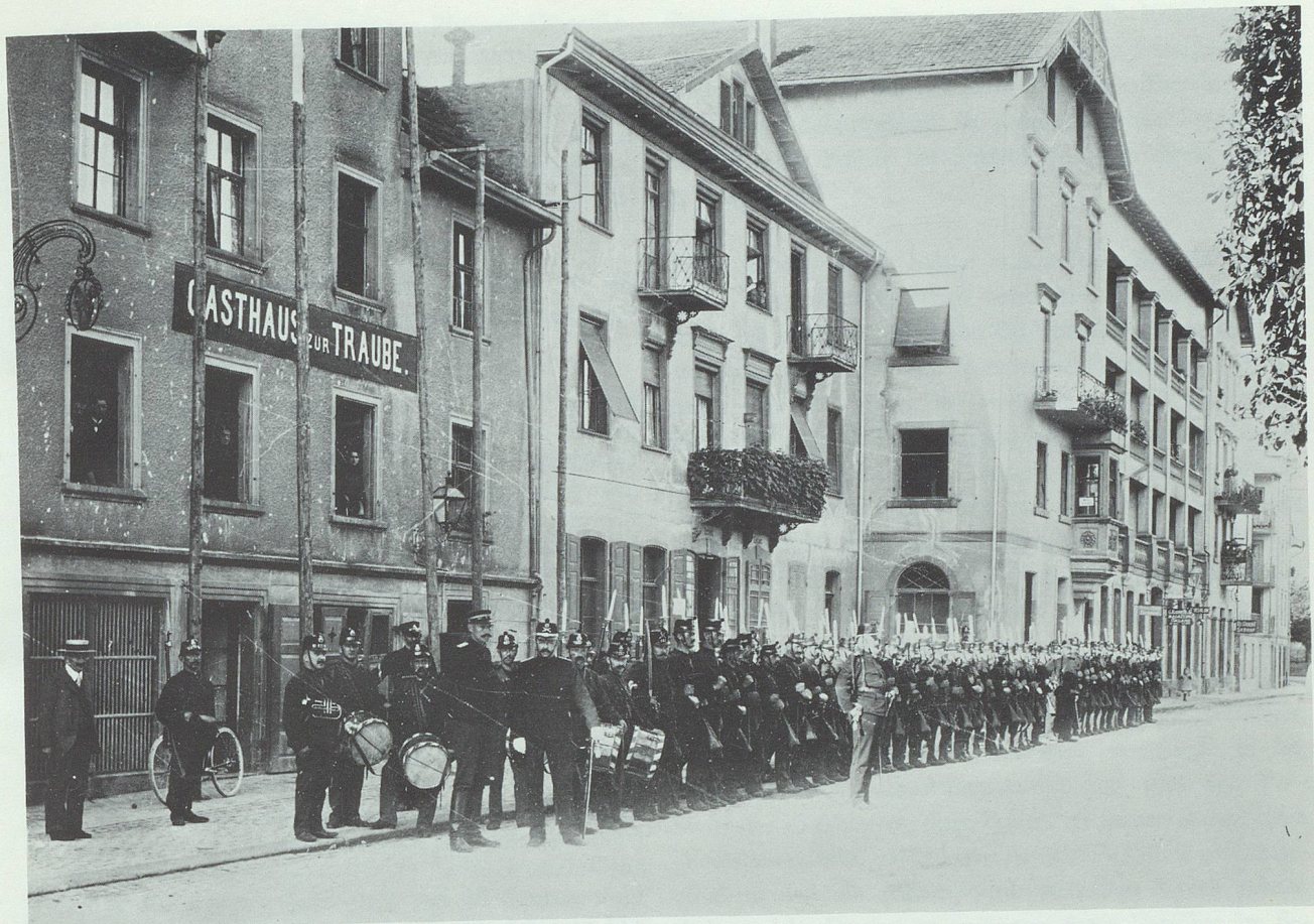
Landwehrcompagnie vor der «Traube»