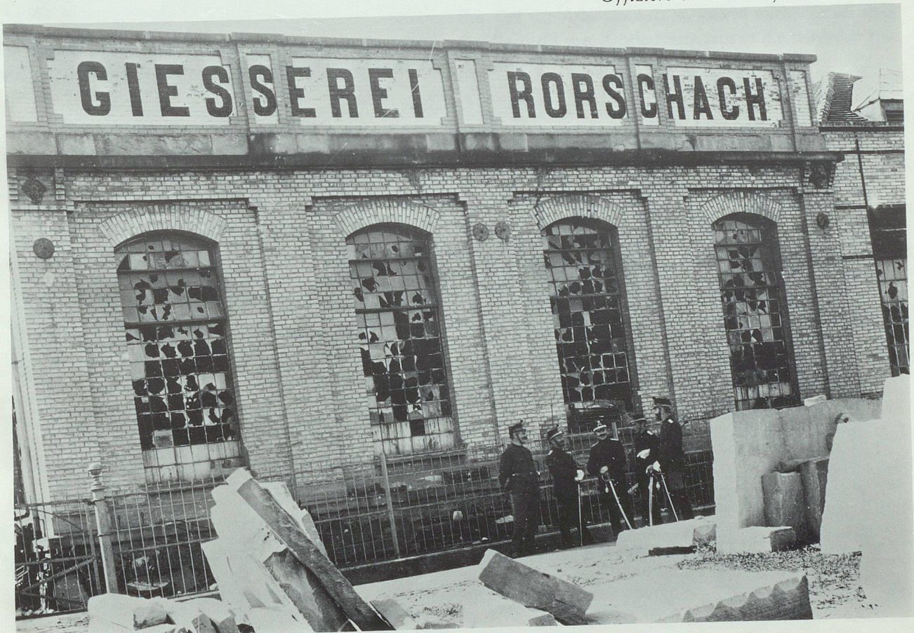
Offiziere vor der Gießerei Rorschach