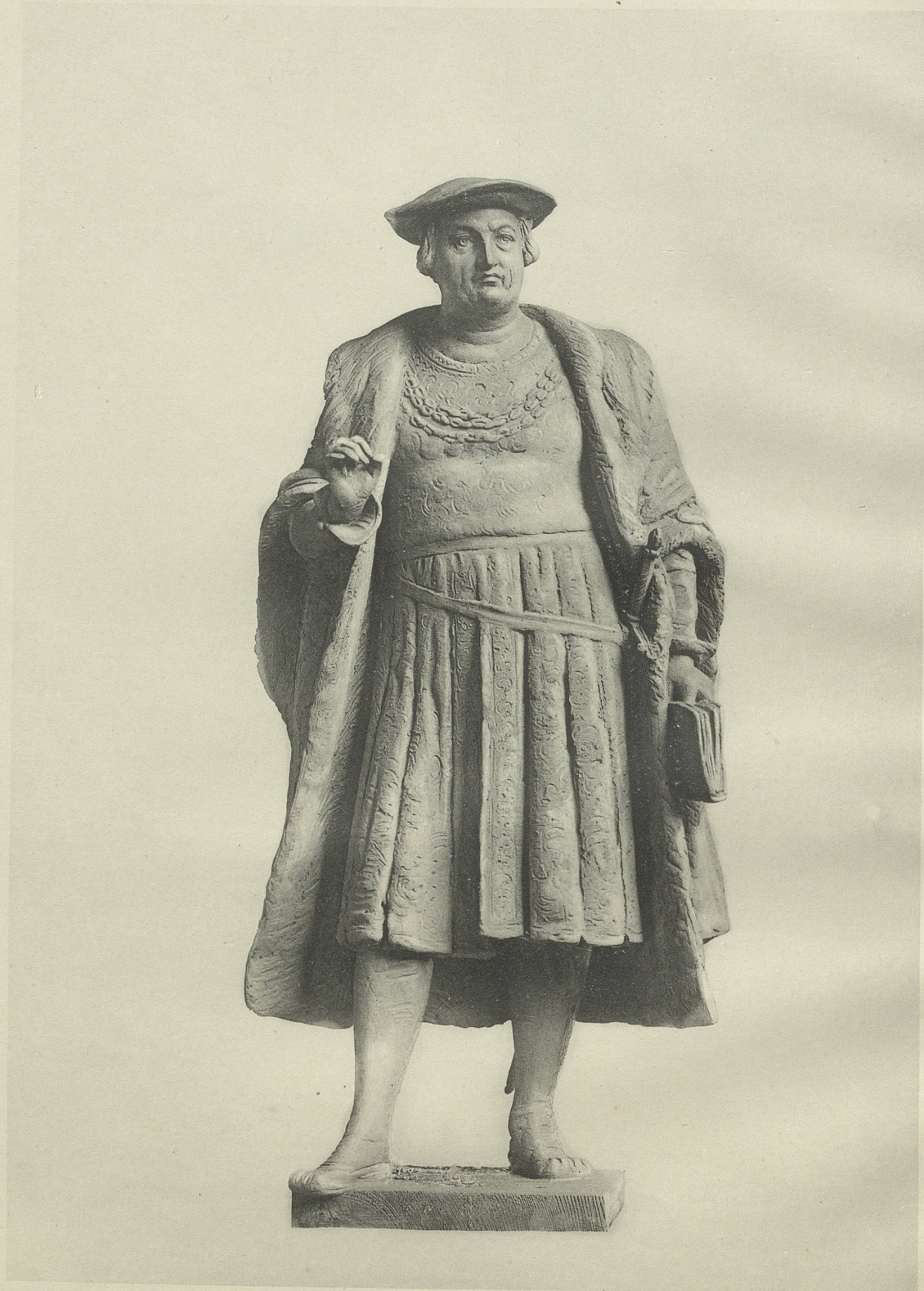
MODELL ZU EINEM VADIAN-DENKMAL IN ST. GALLEN