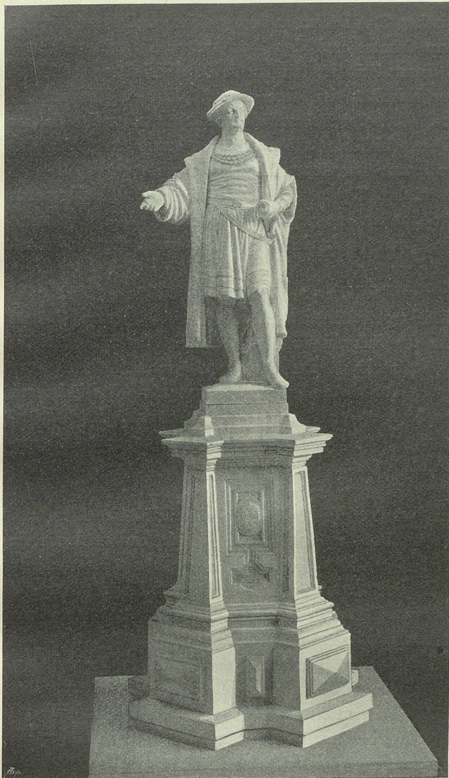
Entwurf zu einem Vadian-Denkmal von Robert Dorer.