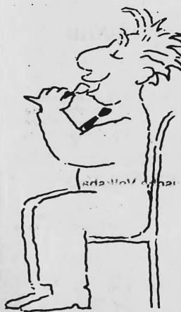
Das Kleininserat. Der ideale Platz, um für seine Spezialitäten Feinschmecker zu finden. Kleine Inserate. Grosse Wirkung. Publicitas.