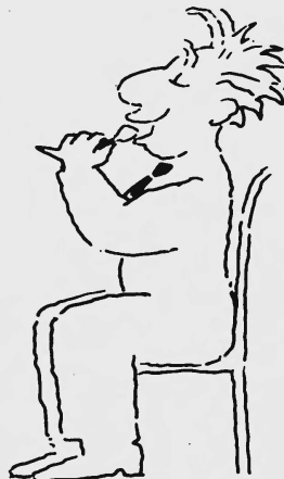
Das Kleininserat. Der ideale Platz, um für seine Spezialitäten Feinschmecker zu finden. Kleine Inserate. Grosse Wirkung. Publicitas.

A. Amman SA/AG 1700 Fribourg Pérolles 33 Tél. 037 22 10 29