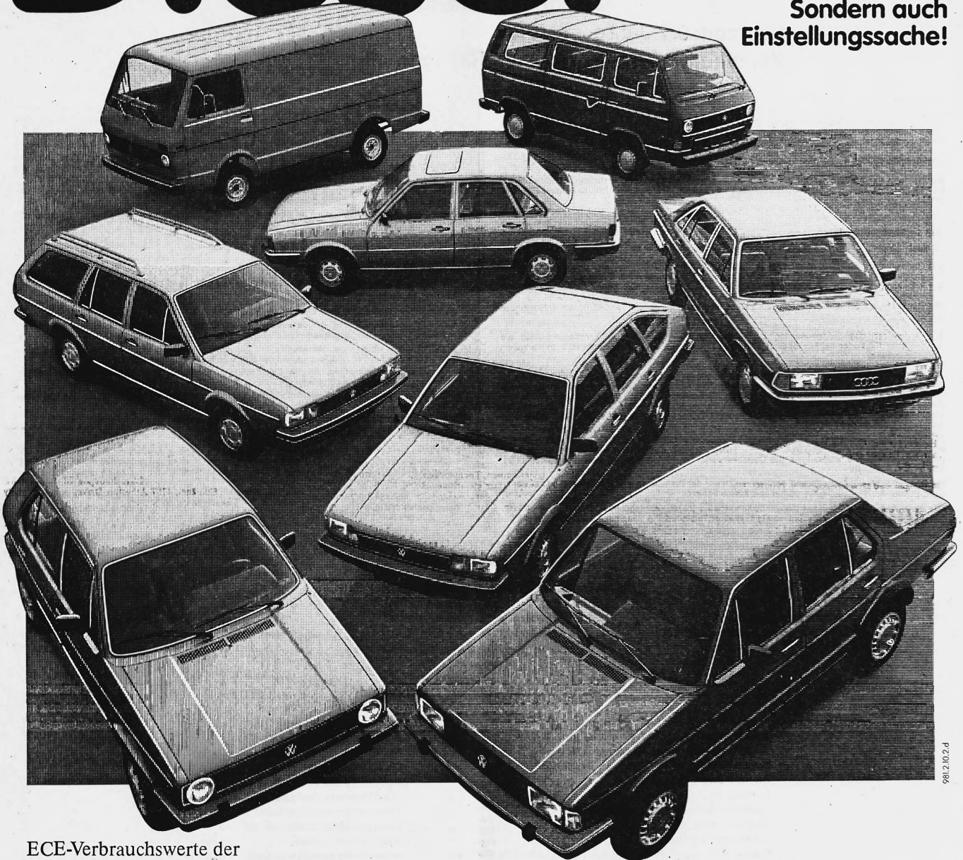
ECE-Verbrauchswerte der Diesel-Modelle von Audi und VW (4/5-Gang)