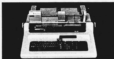
RUF-Büro-Computer mit oder ohne Magnetknoten, verschiedene Modelle; auch für kleinere Betriebe