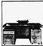
Preiskategorien von Fr. 20 500.- bis ca. Fr. 45 000.-

Fakturier- und Abrechnungsautomaten in 2 Grundmodellen vollelektronischer Konstruktion. 3-4 Grundoperationen, 3-32 Datenspeicher, Anschlussgeräte zur maschinellen Daten-Ein- und -Ausgabe.