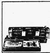
Preiskategorien von Fr. 6100.- bis ca. Fr. 98 000.-

Buchungsautomaten verschiedener Baureihen elektromechanischer und elektronischer Konstruktion mit 2-4 Grundoperationen, 2 - 256 Rechenwerken bzw. Speichern, Volltext oder Kurztext, von der einfachen Vorsteckeinrichtung über den photoelektrischen Konto einzug bis zur automatischen Saldolesung mit Magnetkonten, Anschluss von Karten- und Streifenlochern.