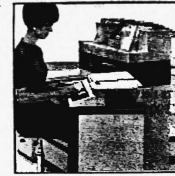
Preiskategorien von Fr. 72 200.- bis ca. Fr. 500 000.-

Leistungsfähige Computer der dritten Generation für die mittlere Datentechnik. Kernspeicherkapazität von 4 - 16 K. Programm- sowie Daten-Ein- und -Ausgabe mit Kassettenmagnetband, alphanumerischer Blockdrucker mit einer Geschwindigkeit von 50-60 Zeichen pro Sekunde. Mit und ohne Magnetkonto-Verarbeitung: Speicherkapazität pro Kontoseite 400 alphanumerische Stellen (800 je Kontoblatt). Volle Integration des Datenflusses durch Peripherie-Geräte.