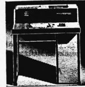
Preiskategorien von Fr. 2450.- bis ca. Fr. 150 000.-

Datenerfassungsgeräte in Off-line-Techniken mit Lochkarten, Lochstreifen und optisch lesbaren Schriften. On-line-Terminals für Simplex- und Duplex-Verkehr mit EDV-Anlagen beliebiger Provenienz.