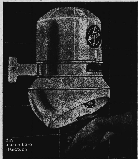
das unsichtbare Handtuch

Mit dem Baege-Händetrockner nie mehr schmutzige und zerrissene Handtücher.