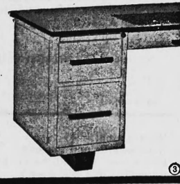
Pultsockel Typ 54 M

Verlangen Sie Prospekte und Bezugsquellenangaben