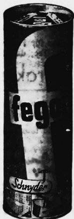
Die Marke wird blau und weiss ausgeführt.

Haushaltungs- und Industriegewaschen, Waschpulver und Waschmittel aller Art, Putz- und Reinigungsmittel, Spül- und Weissmittel, Toilettenseifen und kos- metische Produkte.