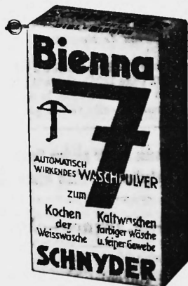
Farbenausführung: gelb und blau.

Haushaltungs- und Industriegewaschen, Waschpulver und Waschmittel aller Art, Putz- und Reinigungsmittel, Spül- und Weissmittel, Toilettenseifen und kos- metische Produkte.