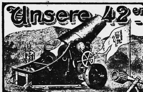
La Grosse Bertha — Die Dicke Berta (27. 11. 1914)

Il se remémorera l'inauguration du Transsibérien, assistera à l'apparition des premiers tramways, du phonographe, du téléphone ou de la bicyclette; il admirera au passage les premiers «aéroplanes» et évoquera les voyages des dirigeables Zeppelin, la construction de la Tour Eiffel, le percement du tunnel du Simplon, le lancement du Titanic, la construction du chemin de fer de la Jungfrau, terminant cette revue par les soucoupes volantes et les récents Sputniks.