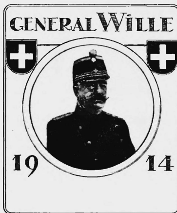
Le portrait du Général Wille — Bildnis des Generals Wille (6. 4. 1915)

Un peu toutes les grandes vedettes de la politique, des sciences et des arts ont tour à tour, au fur et à mesure de leur apparition dans le ciel de la gloire, été appelées à sacrifier de la même façon sur l'autel de Mercure, depuis l'Empereur Guillaume I er , en passant par le Maréchal Joffre, jusqu'à Winston Churchill ou Monty, sans parler de nombre de nos anciens conseillers fédéraux tels que Ruchonnet ou Motta; depuis Pasteur jusqu'à Sauerbruch; depuis Charlie Chaplin jusqu'à Lawrence Oliver.