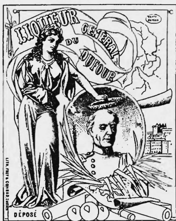
Le «Couronnement» du Général Dufour — Die «Krönung» des Generals Dufour (16. 8. 1883)

L'historien y trouvera maints aspects de la petite comme de la grande histoire. C'est ainsi que les colonnes de la Feuille officielle suisse du commerce ont elles aussi fixé pour la postérité le portrait des trois premiers généraux de notre histoire, portraits destinés à figurer sur d'innombrables bouteilles de liqueur, paquets de cigares ou autres produits.