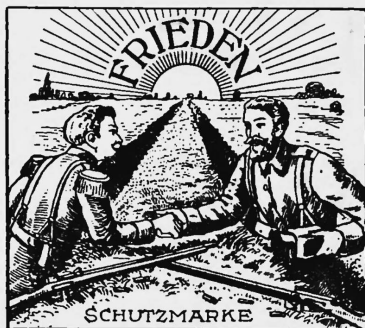
Espoir prématuré — Verfrühte Hoffnung (8. 9. 1915)

Beim Durchblättern der Markensammlung wird der Historiker die beiden Weltkriege im Bild wiedererleben, mit all ihren Uniformen und verschiedensten Waffen.