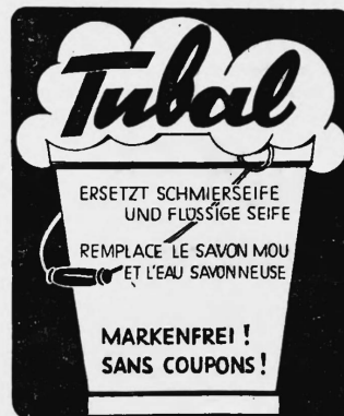
Les produits de remplacement en 1941 — Ersatzprodukte im Jahr 1941 (25. 10. 1941)