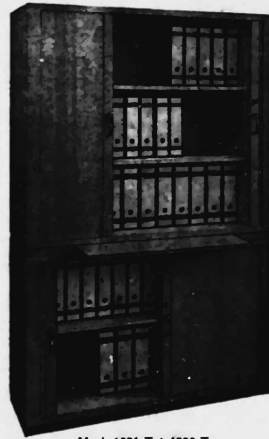
Mod. 1021 T + 1020 T

Neue - Schrankmodelle mit betont wohnlichem Charakter