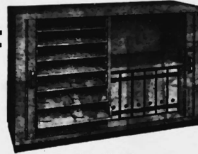
Mod. 1027 T E

Neue - Schrankmodelle mit betont wohnlichem Charakter