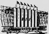
CASTLE BROMWICH — Sections du Bricolage et du Chauffage, de l'Électricité, de la Mécanique et de la Quincaillerie. Exposants: 1.300; superficie (y compris les stands de plein air): 46.000 mètres carrés.