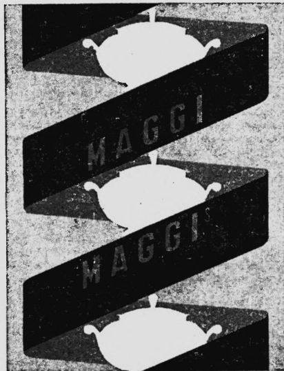
La marque est exécutée en rouge, jaune et blanc sur fond argent.

Tous produits alimentaires; condiments; produits diététiques et de régime.