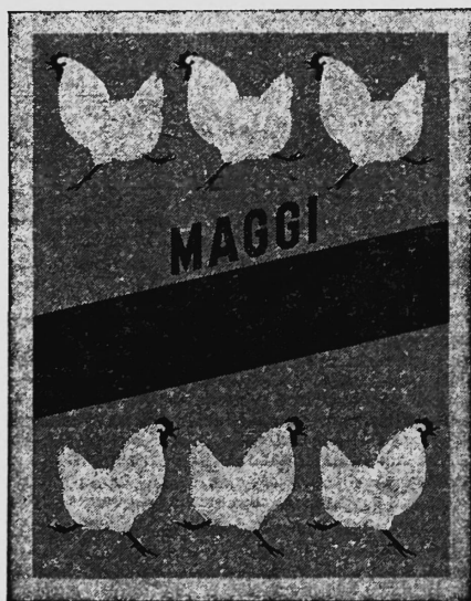
La marque est exécutée en rouge, jaune et argent.

Potages de volaille et potages préparés avec des œufs.