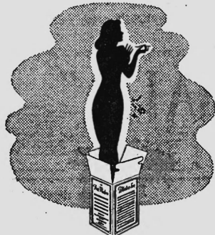
The MIDRO Tee