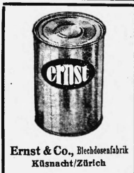
Ernst & Co., Blechdosefabrik Küssnacht/Zürich