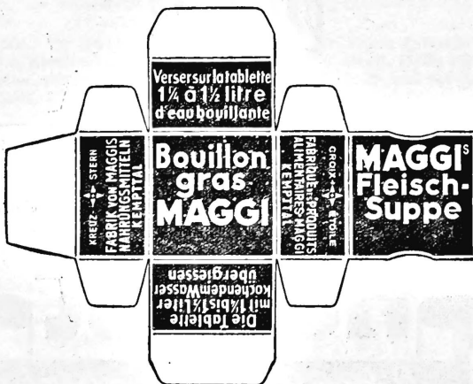
(Die Marke wird gelb und rot ausgeführt.)

N° 90313. Date de dépôt: 3 avril 1937, 4 h. Fabrique des Produits alimentaires Maggi, Kempttal (Suisse). Marque de fabrique et de commerce.