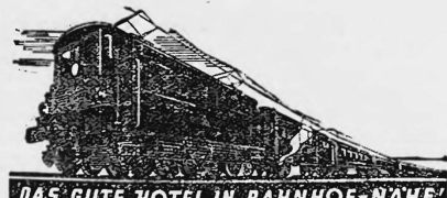
DAS GUTE HOTEL IN BAHNHOF-NAHE!