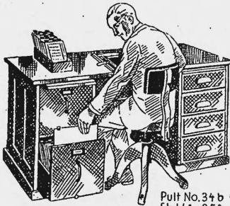
Pult No. 34 b Stuhl * 253