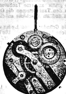
N o 1.