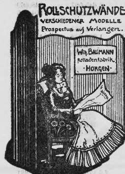
Holzrolladen aller Systeme, (1877.) Rolljalousien Patent 5103.