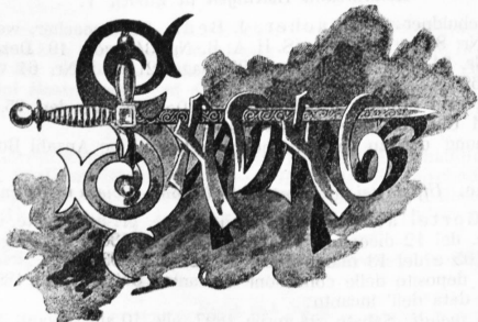
Produits concernant les arts graphiques.