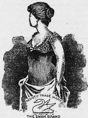
SWISS RIBBED VESTS & UNDERWEAR

Nr. 9583. — 8. Oktober 1897, 3 Uhr p. Ryff & C o , Fabrikanten, Bern (Schweiz).