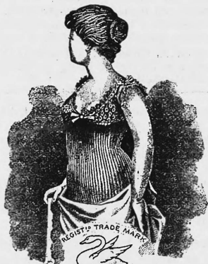
THE SWAN BRAND

Nr. 9583. — 8. Oktober 1897, 3 Uhr p. Ryff & C o , Fabrikanten, Bern (Schweiz).