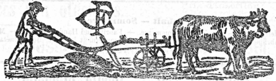
Faux et faucilles.