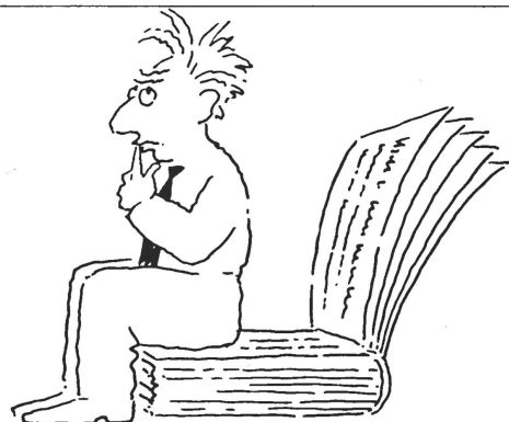
Das Kleinsinserat. Der ideale Platz, um für eine Fremdsprache die richtige Schulbank zu finden. Kleine Inserate. Grosse Wirkung. Publicitäts.

Der Verwaltungsrat der Skilift Junker AG