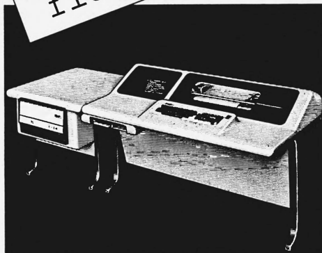
RUF-DIALOG für Datenerfassung und Datenabfrage am Arbeitsplatz, on-line zum Computer

La société TRZ Teilnehmerrechenzentrum AG, 23, route des Jeunes, 1211 Genève 26, informe tous les intéressés qu'elle n'a en aucune façon repris ni les actifs, ni les passifs de la société IRTE Informatique, précédemment domiciliée à la même adresse.