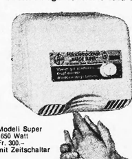
Modell Super 1650 Watt Fr. 30.- mit Zeitschalter

Baegel-Trockner trocknen angenehm, schnell und gründlich (von zwei Seiten intensiver Warmluftstrom). Einfache Bedienung: Ein Knopfdruck genügt, 40 Sekunden lang zirkuliert sympathisch temperierte Luft. Fertig. Kein Ärger mehr mit zer- rissenen, schmutzigen Handtüchern. Weitere Vorteile sprechen für Baegel-Trockner: praktisch unbeschränkte Lebens- dauer (Spezialmotor mit Dauerschmierung auf Kugellagern). Thermoschutz (kein Überhitzen möglich). Robustes Stahlgehäuse. Geringe Betriebskosten. Kleiner Preis. Baegel-Trockner sind SEV-geprüft, geräuscharm und platzsparend.