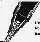
L'encre Jax No 1 n'est pas toxique

3 km d'écriture. Jax No 1 contient 3 fois plus d'encre liquide que les flacons remplis surtout d'ouate saturée d'encre.