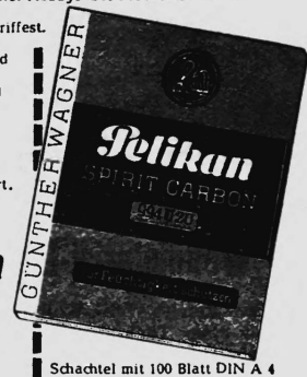
Schachtel mit 100 Blatt DIN A 4