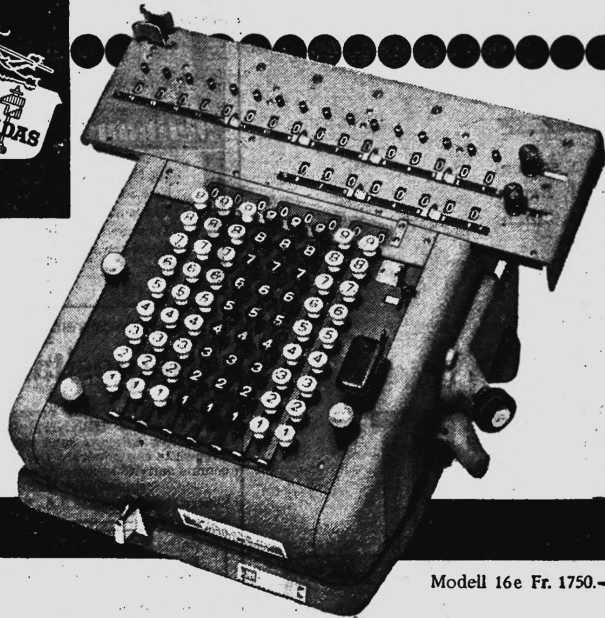
Modell 16e Fr. 1750.-