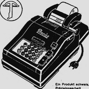
Ein Produkt schweiz. Präzisionsarbeit