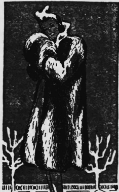
Das beste Weihnachtsgeschenk ein langhaariges Pelzmaut Päckmarc ZÜRICH BAHNHOFSTR.35