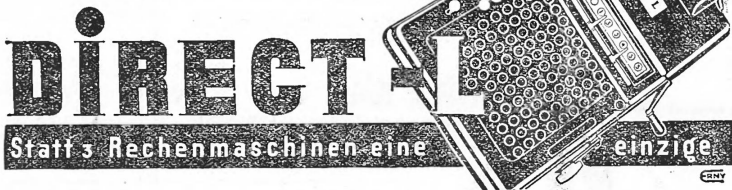
Machine zum Schreiben eingestellt

Verlangen Sie kostenlose Vorführung durch die Platzvertreter: