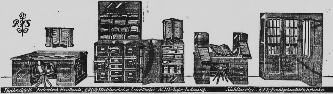
Hochwertigste Federstich-Fauteuils ERGA-Stahlmöbel u. Leichttafeln ACME-Tube-Indizierung Sichtkartei RFS-Reihenbücherschränke

Régie des annonces: PUBLICITAS Société Anonyme Suisse de Publicité