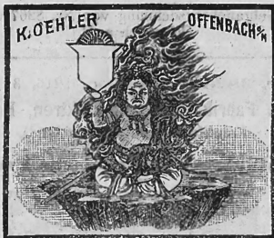
(Uebertragung von Nr. 8277 der Firma K. Oehler, Offenbach a. M.)

Nr. 38260. — 29. April 1916, 3 Uhr. Chemische Fabrik Griesheim-Elektron, Fabrikation, Frankfurt a. M. (Deutschland).