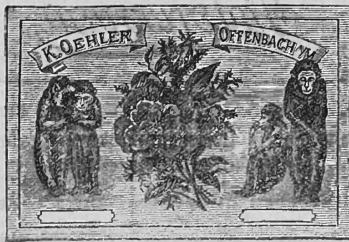
(Uebertragung von Nr. 8282 der Firma K. Oehler, Offenbach a. M.)

Nr. 38259. — 29. April 1916, 3 Uhr. Chemische Fabrik Griesheim-Elektron, Fabrikation, Frankfurt a. M. (Deutschland).