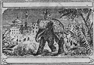
(Uebertragung von Nr. 8281 der Firma K. Oehler, Offenbach a. M.)

Nr. 38258. — 14. April 1916, 3 Uhr. Chemische Fabrik Griesheim-Elektron, Fabrikation, Frankfurt a. M. (Deutschland).