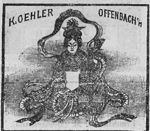
(Uebertragung von Nr. 8278 der Firma K. Oehler, Offenbach a. M.)

Nr. 38261. — 2. Mai 1916, 8 Uhr. Nestlé and Anglo-Swiss Condensed Milk Company, Fabrikation und Handel, Cham und Vevey (Schweiz).