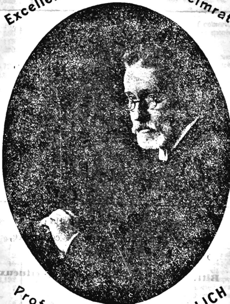
Professor Dr. PAUL EHRLICH