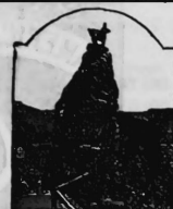
Hirschesprung or Deer Leap.

Zu medizinischem und pharmazeutischem Gebrauch präparierte chemische Substanzen.