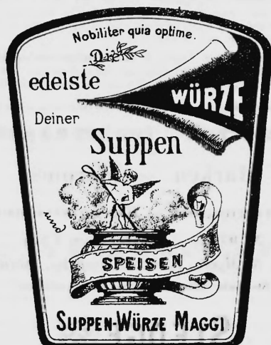
Nahrungs- und Genussmittel.

Nr. 9781. — 7. Januar 1898, 8 Uhr a. Fabrik von Maggi's Nahrungsmitteln, A.-G. , Kempthal-Lindau (Schweiz).