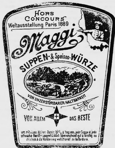
Nahrungs- und Genussmittel.

Nr. 9780. — 7. Januar 1898, 8 Uhr a. Fabrik von Maggi's Nahrungsmitteln, A.-G. , Kempthal-Lindau (Schweiz).