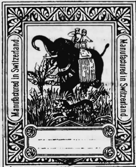
Bedruckte und gefärbte Baumwolltücher.

Friedrich Oertly, Fabrikant, Näfels (Schweiz).