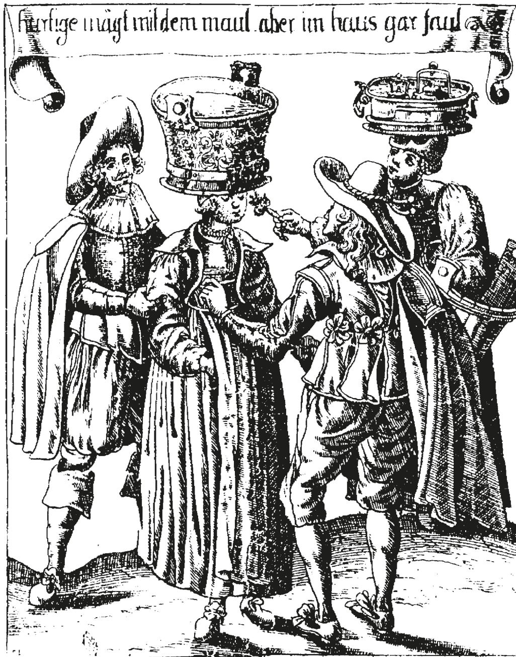
Abb. 3: «Hurtige mägt mit dem maul aber im haus gar faul» (Quelle: Hanns Heinrich Glaser, Basler Kleidung , 2. Aufl. Basel 1634, S. 52).