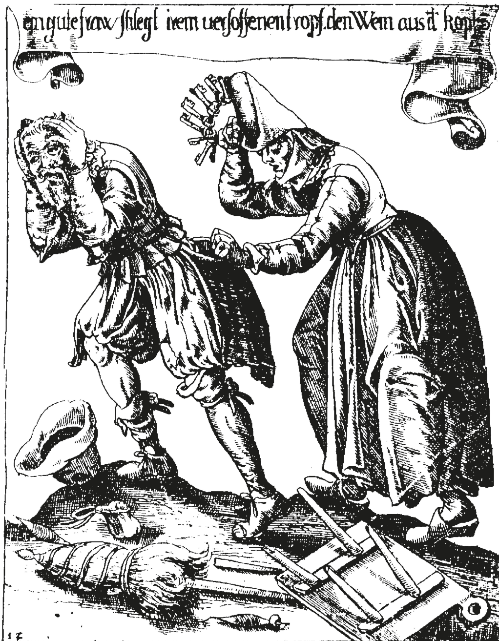
Abb. 2: «Ein gute frau shlegt irem uersoffenen tropf den wein aus dem kopf» (Quelle: Hanns Heinrich Glaser, Basler Kleidung , 2. Aufl. Basel 1634, S. 53).