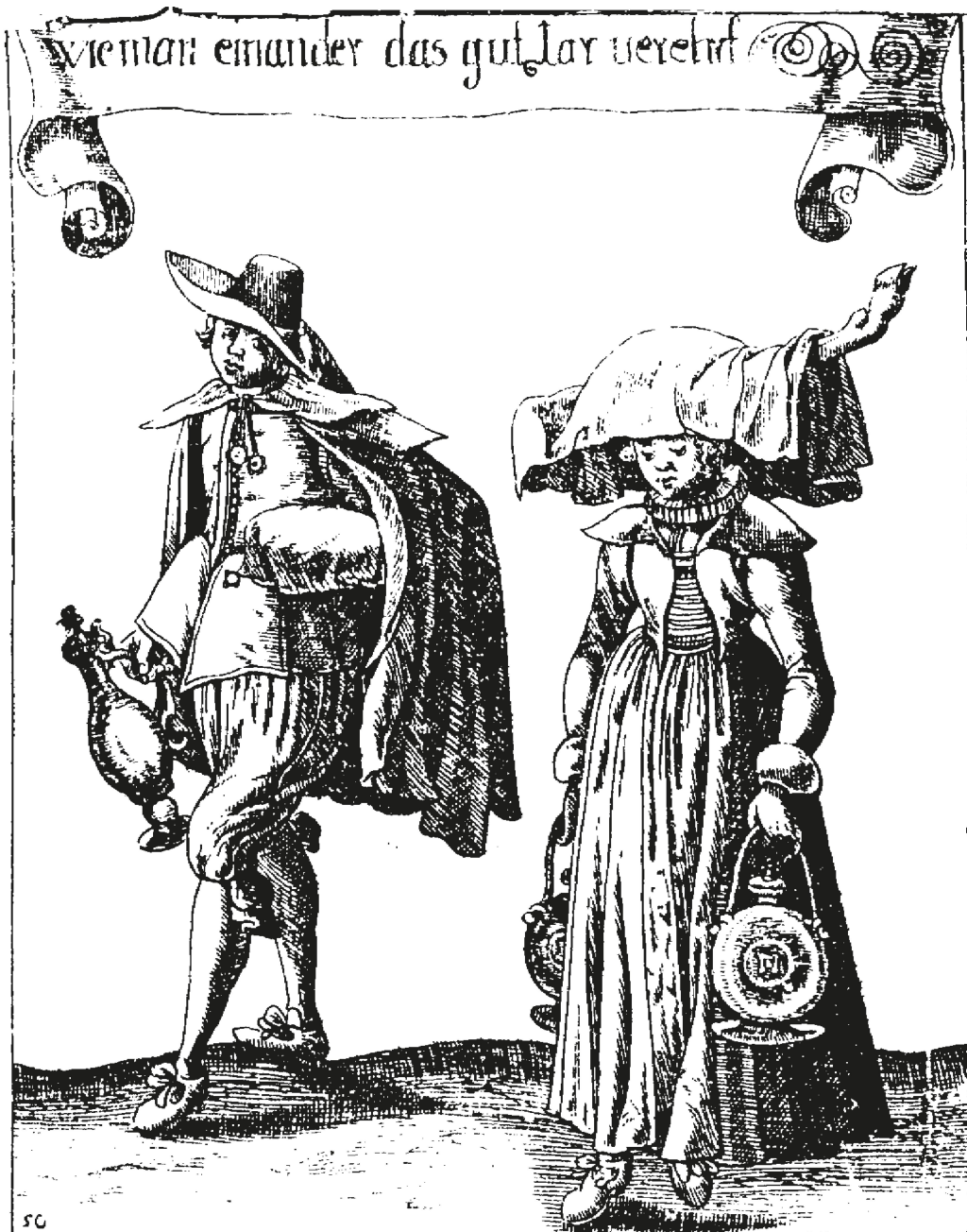
Abb. 1: «Wie man einander das gut iar verehrt» (Quelle: Hanns Heinrich Glaser, Basler Kleidung , 2. Aufl. Basel 1634, S. 51).