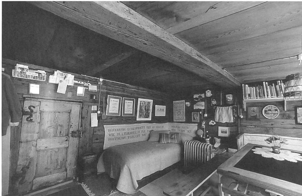
Blick in das Arnold-Niederer-Haus in Ferden.

wurde. Es hat Telefon sowie eine geordnete Bibliothek und eignet sich gut als wissenschaftliche Arbeitsstätte. Es soll die Erinnerung an Arnold Niederer wachhalten und hat so quasi Museumscharakter; deshalb wird es nicht offiziell vermietet, sondern nur an Leute, die der Präsidentin oder einem Stiftungsratsmitglied persönlich bekannt sind. Der Mietpreis wird bewusst niedrig gehalten, um auch Studierenden den Aufenthalt zu ermöglichen, doch sollten die anfallenden Unkosten gedeckt werden können.