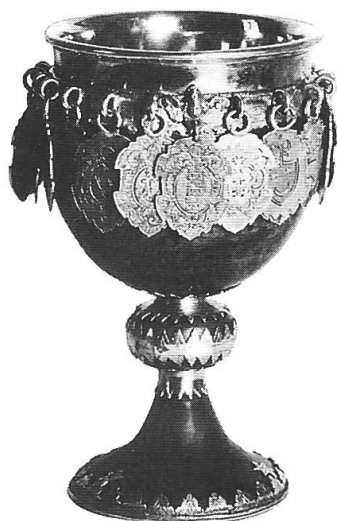
Ill. 2: Coupe des Abbés de la Confrérie des vignerons, 1618.