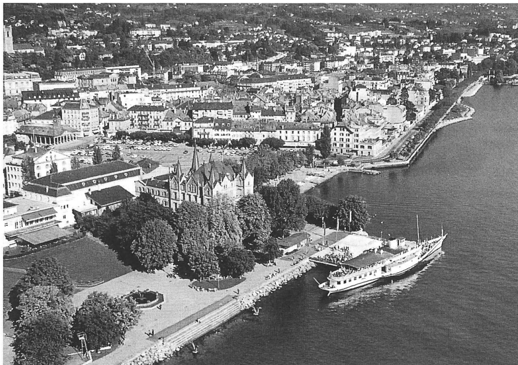
Ill. 1: Vevey et sa Grand-Place (place du marché).

La prochaine assemblée générale de la SSTP se déroulera à Vevey et dans ses environs les 26 et 27 septembre 1998. Cette ville de 15700 habitants se prépare pour la prochaine Fête des vignerons de 1999. Il n'y a que quatre ou cinq fêtes par siècle. Nous traverserons la Grand-Place où elle se déroulera: avec ses 20000 m 2 , elle est la deuxième plus grande place de marché d'Europe, après celle de Lisbonne (ill. 1).