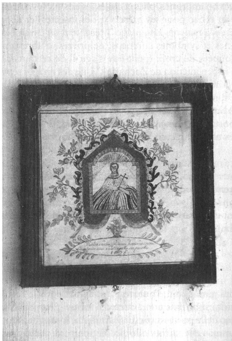
Fig. 3: Image de sainte Agathe. Dessin aquarellé daté de 1836. Montfaucon, Le Péché.

Dans un article publié en 1952 dans Folklore suisse , Jules Surdez signale que ces images étaient imprimées à Delle et qu'elles étaient vendues dans la région par des colporteurs alsaciens. Il précise plus loin que «dans maintes paroisses de l'Ajoie, on apposait à côté des «Sainte-Agathe» des images de Saint Vendelin, pour préserver le bétail, les chevaux surtout, de toute maladie.» 8