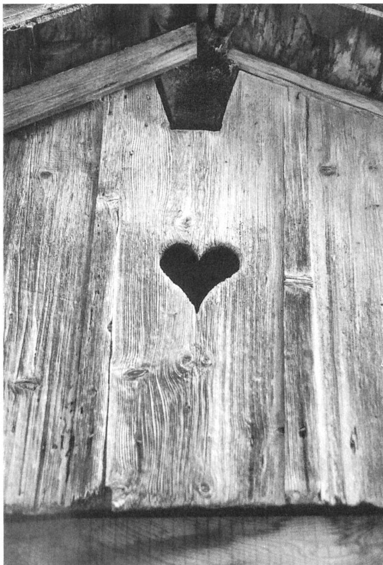
Fig. 2: Jour en forme de cœur, motif fréquent du décor paysan. Le Noirmont, Les Esserts.

éléments en forme de corne évoquant l'aspect et le mouvement d'une hélice. Bien qu'on ne puisse pas l'expliquer, on ne peut s'empêcher d'évoquer aussi la parenté formelle de ce motif avec le symbole taoïste du yin et du yang.