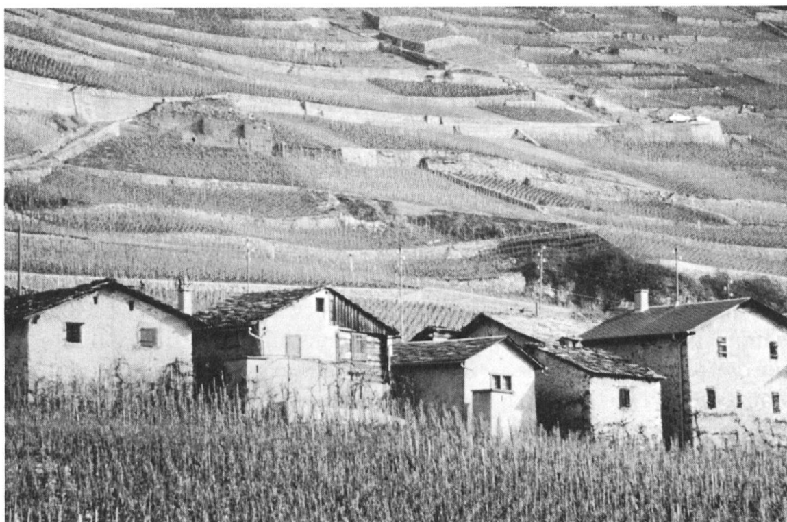
Fig. 1: Mazots à Fully en 1988.

Dans cette région, «mazot» signifie «pied-à-terre, petite maison où l'on peut vivre provisoirement loin de chez soi, le temps d'effectuer des travaux saisonniers: s'applique presque exclusivement à des maisons de vignes».