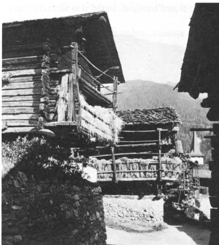
Fig. 5: Raccards à St-Luc.

L'abandon de la culture des céréales fait perdre au raccard sa raison d'être. On a tenté de donner une fonction nouvelle à ces bâtisses typiques du paysage valaisan et d'en faire des maisons pour vacanciers. Or les parois peu étanches, l'absence de fenêtres et l'espace vide entre le soubassement et la grange proprement dite rendent ces tentatives aussi discutables que risquées. Faut-il laisser les raccards livrés à leur sort?