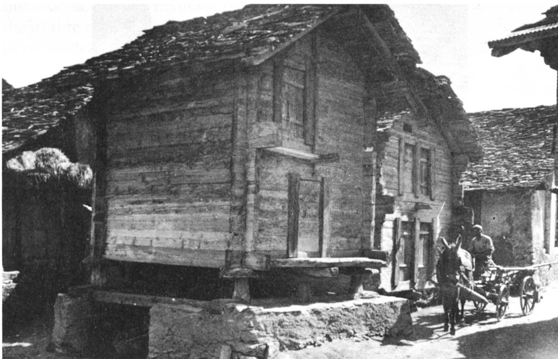
Fig. 4: Grenier à Lens (Photo E. Schüle).

attentivement la description des immeubles mis en vente, on s'aperçoit qu'il ne s'agit en tous cas pas d'un mazot, et généralement pas non plus d'un raccard. Ces deux mots semblent devenus, selon le promoteur immobilier, synonyme de vieille bâtisse plus ou moins délabrée, ou au moins «typique» pour attirer les acheteurs nostalgiques du passé.