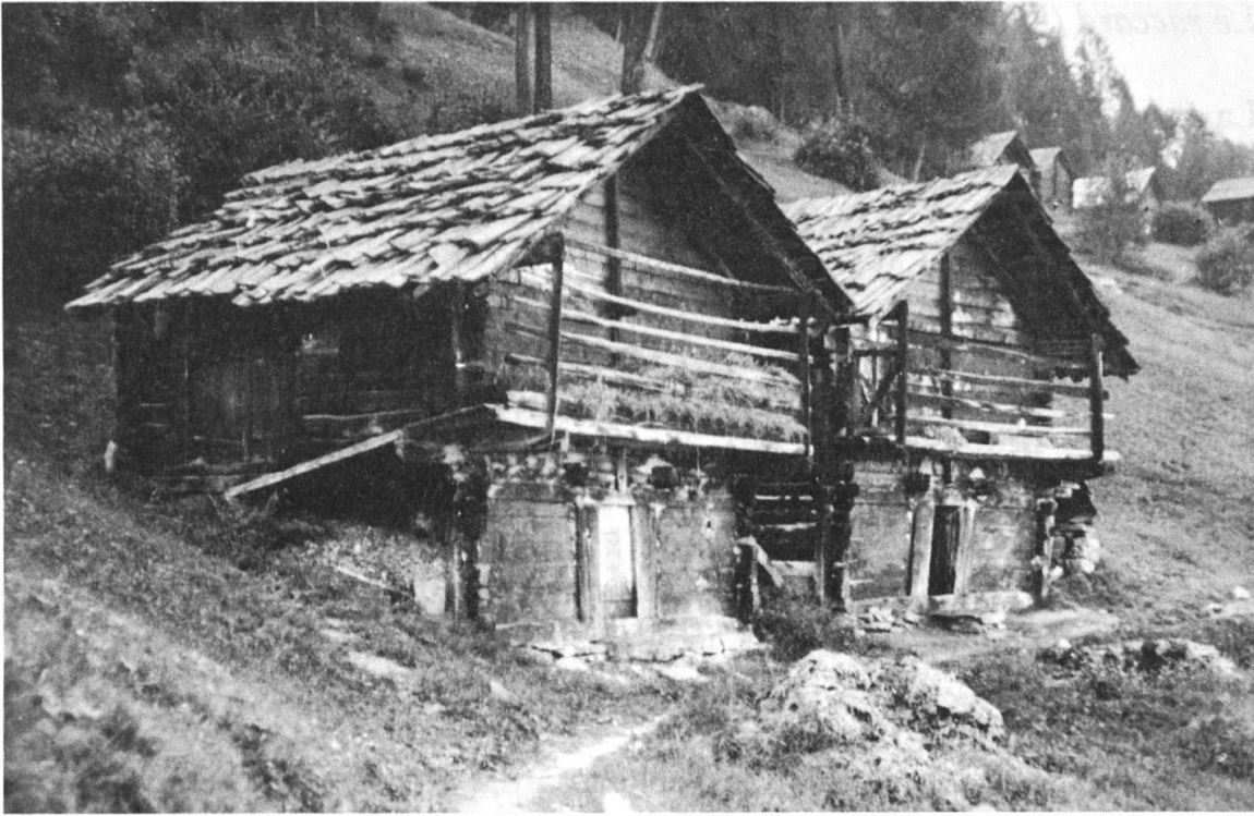
Fig. 3: «Granges-écuries» à Hérémente.

attentivement la description des immeubles mis en vente, on s'aperçoit qu'il ne s'agit en tous cas pas d'un mazot, et généralement pas non plus d'un raccard. Ces deux mots semblent devenus, selon le promoteur immobilier, synonyme de vieille bâtisse plus ou moins délabrée, ou au moins «typique» pour attirer les acheteurs nostalgiques du passé.